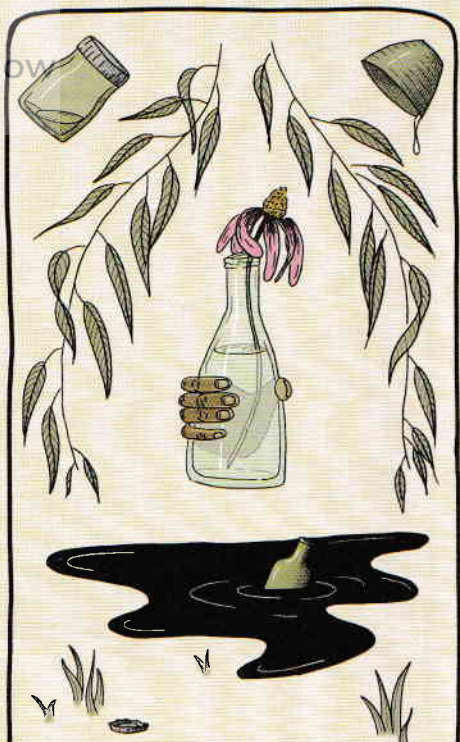
PATRU DE CUPĂ