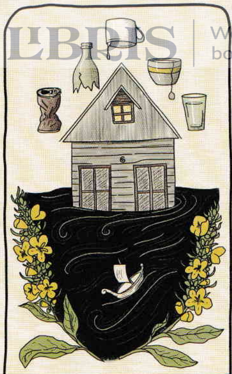
CINCI DE CUPĂ